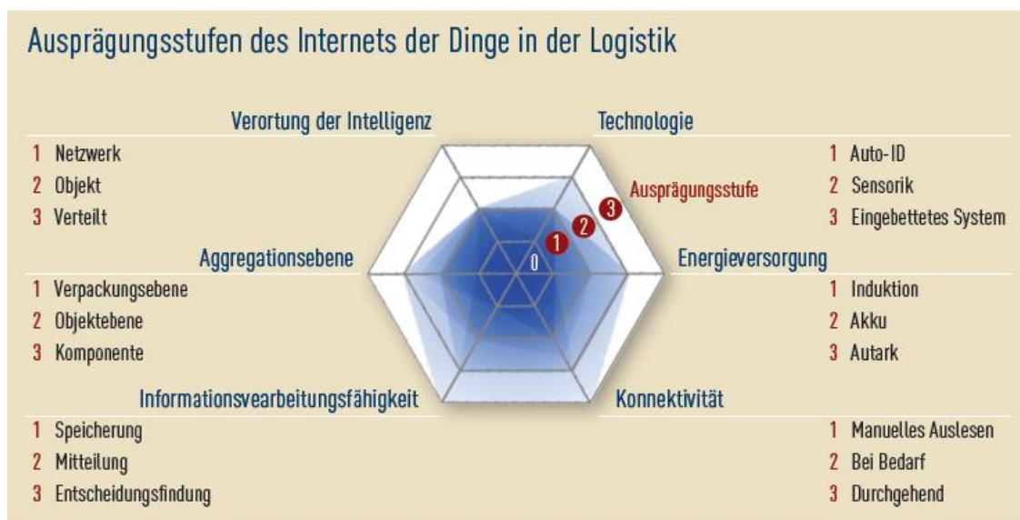
Abb. 2: Ausprägungs- und Diffusionsstufen des „Internets der Dinge“ in den untersuchten Logistikunternehmen

Merkmale Konnektivität (aktiv) und Informationsverarbeitung (Entscheidungsfähigkeit aufgrund Info-Verarbeitungsfähigkeit) charakterisieren sehr stark die Eigenständigkeit der Systeme und symbolisieren damit die Intelligenz der technischen Systeme. Die Untersuchungsergebnisse aus den Fallstudien zeigten für die Praxis nur eine geringe Ausprägung von IdD-Technologien, meist auf Stufe 1 (siehe Abbildung 2 dunkelblaue Einfärbung). Obwohl zu erkennen war, dass in den Unternehmen eine zunehmende Auseinandersetzung mit den neuen Technologien zum IdD stattfindet, erreichte kaum ein Unternehmen die zweite oder gar dritte Ausprägungsstufe. Ist eine Ausprägungsstufe in allen Unternehmen identifiziert worden, dann ist eine dunkelblaue Färbung in der Abbildung 2 zu erkennen. Wird eine Entwicklungsstufe von keinen Unternehmen erreicht, ist die Färbung weiß. Bei einer Einfärbung der gesamten Matrix kann man von einer vollständigen Umsetzung zum „Internet der Dinge“ sprechen. Jedoch zeigen die Ergebnisse, dass bisher die Objekte nicht eigenständig miteinander kommunizieren und keinen direkten Einfluss auf die Warenströme und Prozesse in den Unternehmen nehmen. Von der Version „Industrie 4.0“ mit einer selbständigen, autonomen Steuerung von Logistik- und Produktions-Prozessen ist man noch ein ganzes Stück entfernt.